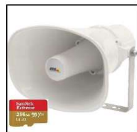
最大16台 まで、連動 可能です。