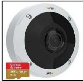
360度防犯カメラ 動体検知録画も可能