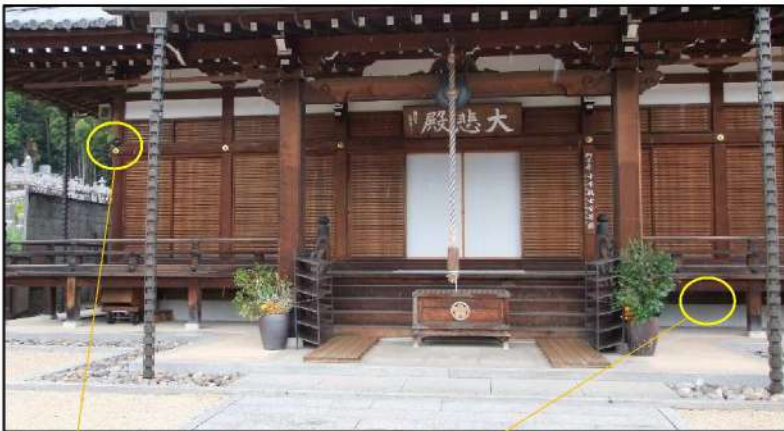
曜日別、時間別に設定可能 音声データ登録可能です。