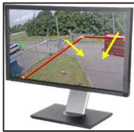
光による誤動作がない、フェンスガード対応 指定した方向にラインを越えた時だけ作動